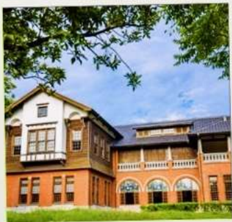
พิพิธภัณฑ์น้ำพุร้อนเป่ย์โถว