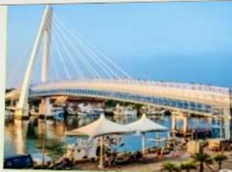
สะพานคู่รักตั้นส่วย