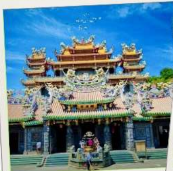
วัดกวนตู่