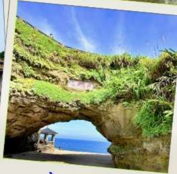
ถ้ำซือเหมิน