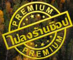
หาดห้าสี