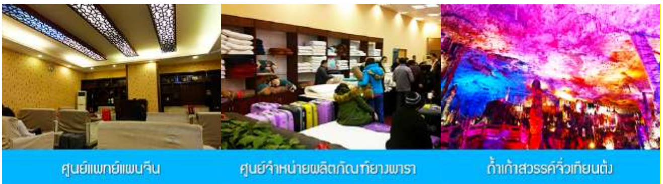
ศูนย์แพทยแผนจีน

อัตราค่าบริการสำหรับโปรแกรมเสริมการแสดงชุด The love Story of Wooden man and Fairy Fox ท่านละ 400 หยวน (หรือประมาณ 2000.-บาทขึ้นอยู่กับอัตราแลกเปลี่ยน) ระยะเวลาที่ใช้ในการเที่ยวชมการแสดง ประมาณ 3 ชั่วโมง รวมเวลา เดินทางไป กลับค่าบริการรวม ค่าบัตรเข้าชม ค่ารถรับ ส่ง และค่าน้ำดื่มของไกด์ท้องถิ่น