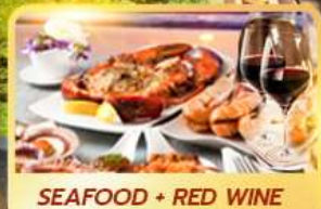
SEAFOOD + RED WINE