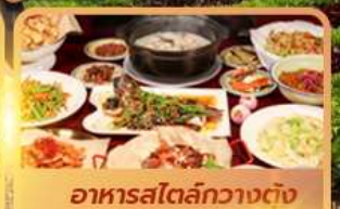
อาหารสไตล์กวางตุ้ง