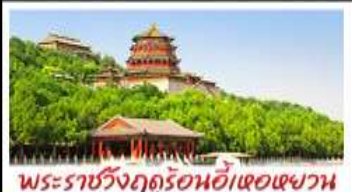
พระราชวังฤดูร้อนอี๋เหอหยวน

ท่าแพงเมืองจีนค่าจวียงกวน - พระราชวังฤดูร้อนอี๋เหอหยวน สวนจิ้งอัน - วัดลามะ - โม่หลงร้านช้อปปิ้ง - โรงแรม 4 ดาว มีชื่อเสียง เปิดบริการที่ สุทึนงโถง MICHELIN GUIDE ร้าน TAO TAO JU