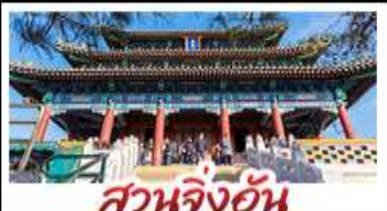
สวนจิ้งอัน