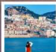
หาดซาโจ่ว

หอออกกาลเวคา • ชายหาดจินซา • จุดชมวิวผิงผิง • ประตูเขินฮันทะเล สวนเหมียนโกซาน • ถนนโบราณเตาหยาง • WEI HAI WINDOW • ถนนฮิวจวิเป่า เรือบลูวิส • ย่านฮั่นเสอผาง • หาดทรายซาโจ่ว • ถนนหลงเจียง พิพิธภัณฑ์ที่ว่าการเก่าเยอรมัน • สะพานข้ามเจียว • ถนนจงซาน โบสถ์ St. Emil • หาดโซเบอร์ NO.3 • สวนจงซาน • ป่าดึกดำ QINGDAO HAITIAN CENTER ชั้น81 • ถนนเทียนชางหาดปิ่นใหญ่จินเต่า โรงแรมเมียร์ชิงเต่า • ถนนกมตันโก่ตง • ศูนย์เรือใบโกลด์บีช