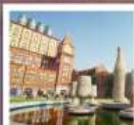
โรงแรมเมียร์ชิงเต่า