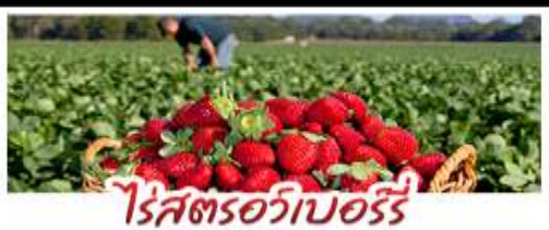
ไร่สตอเบอรี่

คฤหาสน์เหวินเจิง - สวนซากุระชิงเต่า ไร่สตอเบอรี่ - โรงเบียร์ชิงเต่า