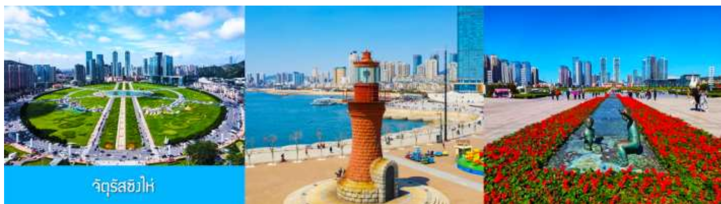
จัตุรัส星海

จากนั้นนำท่านเที่ยวชมและเก็บภาพ พิพิธภัณฑ์ประวัติศาสตร์หลู่ซุ่น 旅顺博物馆 เป็นอาคารพิพิธภัณฑ์เก่าแก่อายุกว่าร้อยปีแห่งแรกที่สร้างขึ้นทางภาคตะวันออกเฉียงเหนือของจีน อาคารพิพิธภัณฑ์มีความโดดเด่นด้วยสถาปัตยกรรมแบบกรีกโรมันยุคเรเนสซองส์ ผสมผสานสถาปัตยกรรมแบบตะวันตกออก ภายในมีการจัดแสดงโบราณวัตถุกว่า 60,000 ชิ้น ท่านสามารถเก็บภาพที่ระลึกด้านหน้าอาคารพิพิธภัณฑ์ และสามารถเข้าชมโบราณวัตถุภายในพิพิธภัณฑ์ได้ตามอัธยาศัย (พิพิธภัณฑ์ปิดทุกวันจันทร์)..