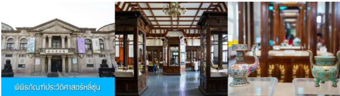
พิพิธภัณฑ์ประวัติศาสตร์หลู่ซุ่น

จากนั้นนำท่านเที่ยวชมและเก็บภาพ พิพิธภัณฑ์ประวัติศาสตร์หลู่ซุ่น 旅顺博物馆 เป็นอาคารพิพิธภัณฑ์เก่าแก่อายุกว่าร้อยปีแห่งแรกที่สร้างขึ้นทางภาคตะวันออกเฉียงเหนือของจีน อาคารพิพิธภัณฑ์มีความโดดเด่นด้วยสถาปัตยกรรมแบบกรีกโรมันยุคเรเนสซองส์ ผสมผสานสถาปัตยกรรมแบบตะวันตกออก ภายในมีการจัดแสดงโบราณวัตถุกว่า 60,000 ชิ้น ท่านสามารถเก็บภาพที่ระลึกด้านหน้าอาคารพิพิธภัณฑ์ และสามารถเข้าชมโบราณวัตถุภายในพิพิธภัณฑ์ได้ตามอัธยาศัย (พิพิธภัณฑ์ปิดทุกวันจันทร์)..