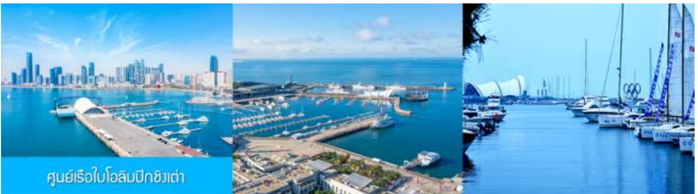
ศูนย์เรือใบโอลิมปิกชิงเต่า

จากนั้นนำท่านเที่ยวชม โรงเบียร์ชิงเต่า 青岛啤酒博物馆 พิพิธภัณฑ์เบียร์ที่ขึ้นชื่อของเมืองชิงเต่า ซึ่งเป็นเบียร์ยี่ห้อแรกที่ผลิตขึ้นในประเทศจีน ชมเบียร์ คอลเลกชันที่มียี่ห้อหลากหลายที่สุดของโลก และชมการจัดแสดงภาพและวิทัศน์เกี่ยวกับวิวัฒนาการของเบียร์ ขั้นตอนการผลิตและอื่น ๆ ที่เกี่ยวข้อง พร้อมชิมเบียร์ชิงเต่า ซึ่งเป็นเบียร์ที่ขายดีที่สุดยี่ห้อหนึ่งของจีน.. (ชิมเบียร์ชิงเต่าท่านละ 1 แก้ว รับกลับอีก 1 ขวดเล็ก ตอนเดินออก)