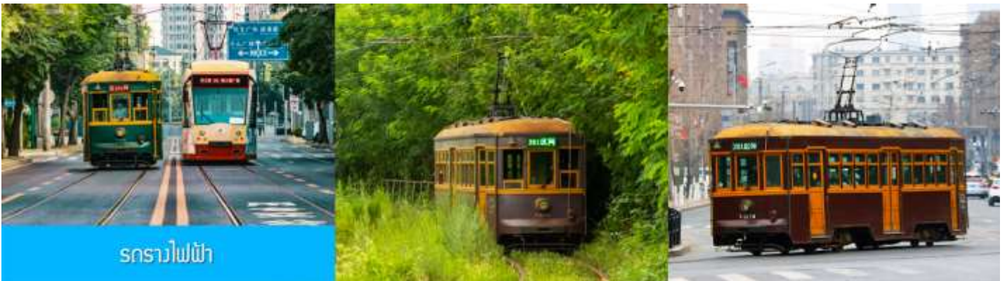
รถรางไฟฟ้า