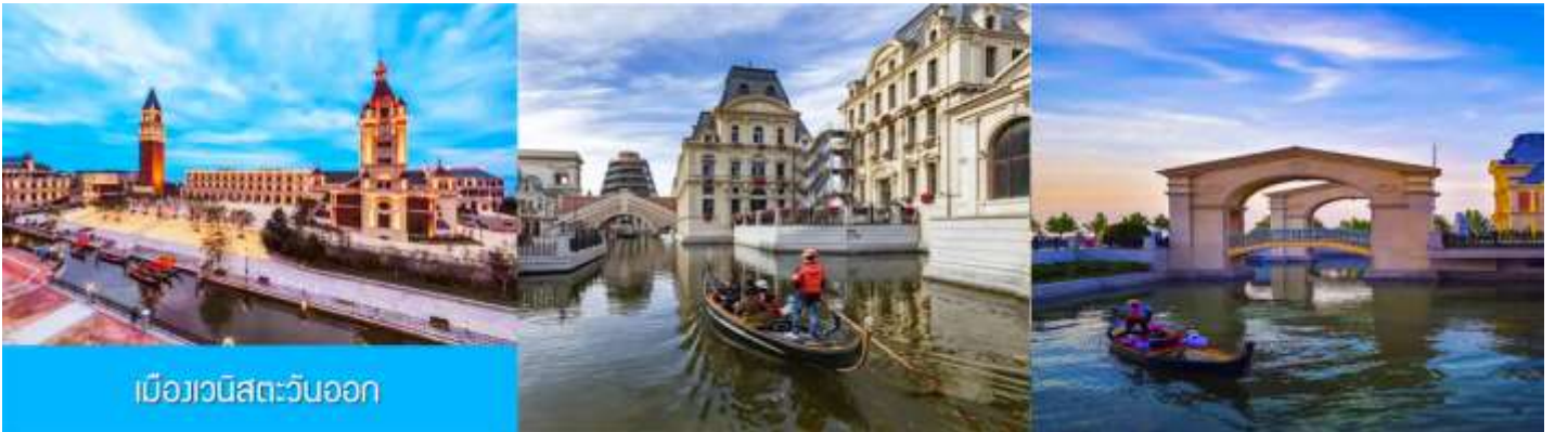
เมืองเวนิสตะวันออก