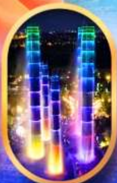
SKP Global Center