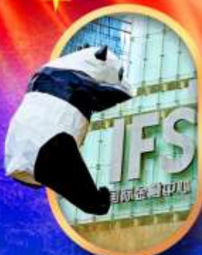
IFS หมีแพนด้าป็นตึก