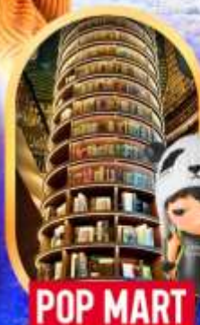
POP MART หอสมุดจงซูเก๋อ