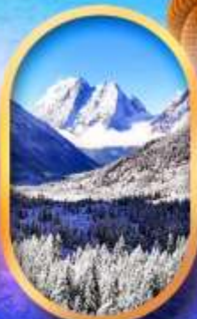
อุทยานสี่ครุฑ