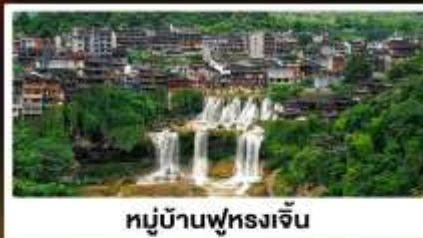
หมู่บ้านฟุทงเจิน