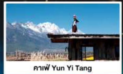
กาแฟ Yun Yi Tang