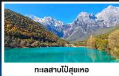
ทะเลสาบโป๋สยู่เหอ