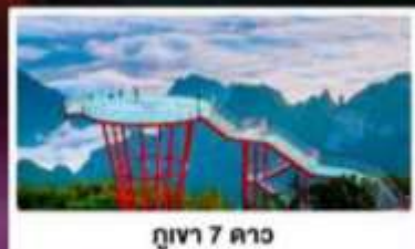
กุเวา 7 ดาว