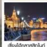
เซี่ยงไฮ้ คคลาสสิกไนท์