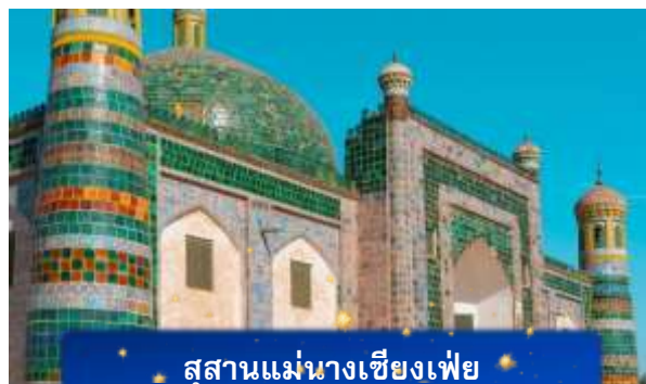
สุสานแม่นางเซียงเฟย

ที่พัก FENGWUQI HOTEL เทียบเท่าหรือระดับ 3 ดาวท้องถิ่น