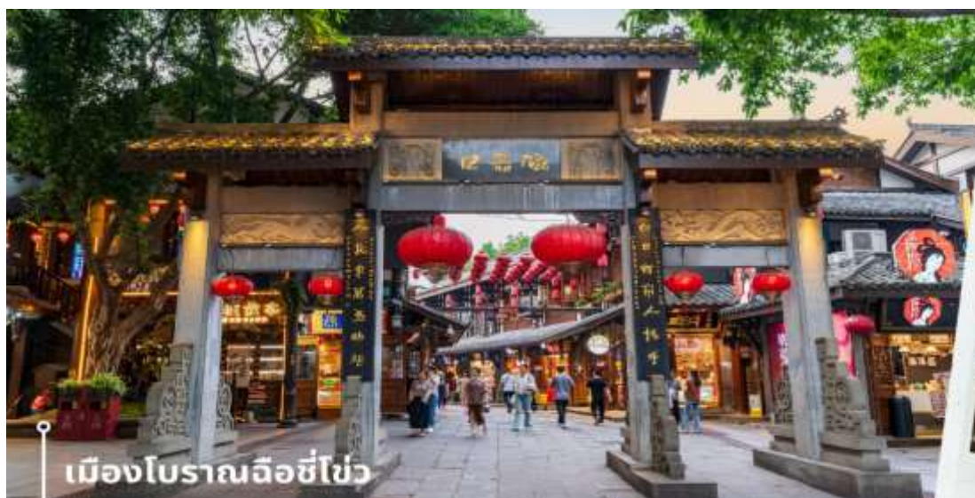
เมืองโบราณฉือชี่โข่ว

หลังจากนั้นนำทุกท่านเดินทางสู่ เมืองโบราณฉือชี่โข่ว เมืองโบราณและสถานที่ท่องเที่ยวชื่อดังในมหานครฉงชิ่ง ประเทศจีน ที่อนุรักษ์สถาปัตยกรรมและวิถีชีวิตดั้งเดิมไว้และได้เป็นสถานที่ท่องเที่ยวระดับ 4A ของจีน ประวัติศาสตร์ยาวนาน มีลักษณะคล้ายตลาดเก่าโบราณริมแม่น้ำเจียหลิง เป็นแหล่งรวมของขนม ของกินพื้นเมือง ของฝาก รวมถึงมีวัดและร้านค้ามากมาย ให้ความรู้สึกเหมือนได้ย้อนเวลากลับไปในอดีต ภายในพื้นที่เต็มไปด้วยร้านค้าเก่าแก่ที่ขายทั้งอาหารพื้นเมือง ของกิน และของฝากมากมาย ทั้งยังมีการแสดงวัฒนธรรมพื้นบ้านให้นักท่องเที่ยวได้ชม ให้ความรู้สึกเหมือนหลุดเข้าไปในซีรีส์จีนย้อนยุค ที่เที่ยวฉงชิ่ง ที่เหมาะแก่การมาเดินเที่ยว ชิมอาหาร ถ่ายรูป และสัมผัสวิถีชีวิตแบบดั้งเดิมของชาวฉงชิ่งอย่างใกล้ชิดในบรรยากาศที่แสนสบาย