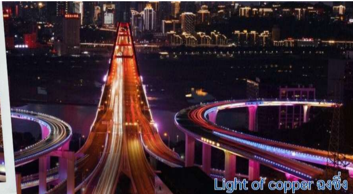
Light of copper ฉงชิ่ง