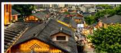
เมืองโบราณสี่ปาที้