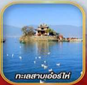
ทะเลสาบเอ๋อร์ไห่