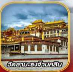
วัดลามะ-ชงจ้านหลิน

เมนูพิเศษ! สุกี่ปลาหมอน อาหารกวางตุ้ง, หมมจีนข้ามสะพานสโตร์ชูนาน