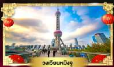
วงเวียนทหิงจู