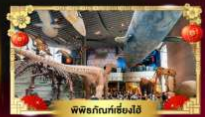
พิพิธภัณฑ์เซี่ยงไฮ้