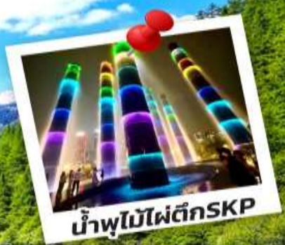
น้ำพุไม้ไฟตึกSKP

อุทยานปี้ฝิงโกว อุทยานจิวจ้ายโกว 6 วัน 5 คืน