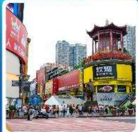
ถนนหวงซิงลู่

• ไอโกล์ เที่ยวสองเมือง ฉางซา จางเจียเจีย เช็กอินประตูสวรรค์ อุทยานเทียนเหมินซาน