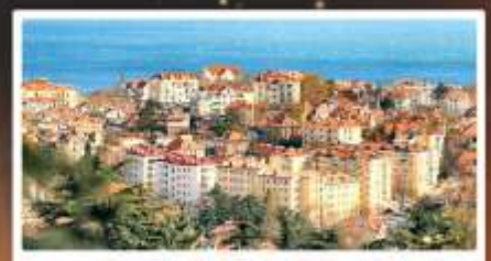
จุดชมวิว Signal Hill Park