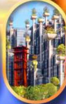
อาคาร 1,000 คัดไม้