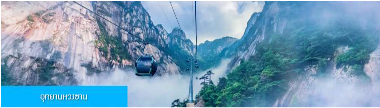
อุทยานหวงชาน

หรือท่านสามารถเลือกซื้อโปรแกรมเสริม ที่เข้าชมอุทยานหวงชานแบบครึ่งวันพร้อมอาหารกลางวัน โดยมีอัตราค่าบริการท่านละ 650 หยวนหรือเท่ากับเงินไทย 3,250 บาท อัตราค่าบริการรวมค่ารถรับส่งไปยังอุทยาน ค่ากระเช้าขึ้น/ลงเขาหวงชาน ค่าอาหารกลางวัน มูลค่า 50 หยวน คำนวณเที่ยวอุทยานของไกด์ท้องถิ่น โดยใช้เวลาเที่ยวชมอุทยานประมาณ 6 ชั่วโมง (รวมเวลานั่งรถเข้า ออกอุทยานและทานอาหารมื้อกลางวัน) (ในกรณีที่สภาพอากาศไม่เอื้อต่อการเที่ยวชม เช่น มีฝนตก หรือมีหมอกหนาจนบดบังทัศนวิสัย ทางทัวร์จะไม่แนะนำให้คุณเลือกซื้อโปรแกรมท่องเที่ยวภูเขาหวงชาน)