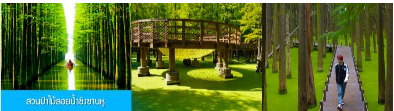
สวนป่าไผ่ลอยน้ำชิวซานหู

พักที่ PAIJING HOLIDAY HOTEL โรงแรมระดับ 4 ดาวท้องถิ่น หรือเทียบเท่า เมืองหวงซาน