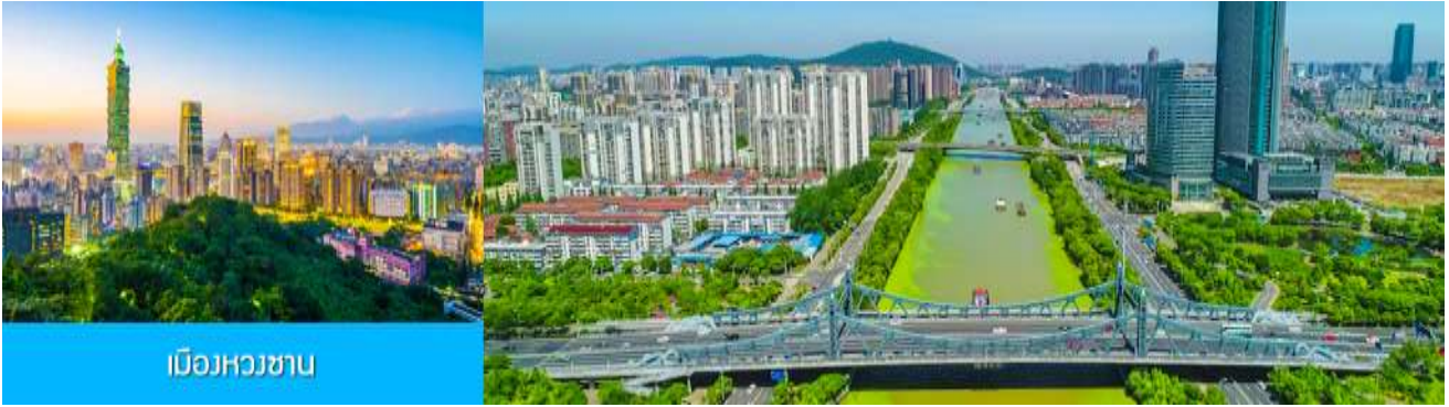
เมืองหวงซาน