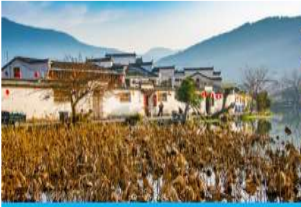
หมู่บ้านโบราณหงซุน