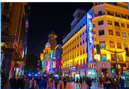
ถนนคนเดินนานกิง