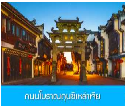
ถนนโบราณฉินซีเหล่าเจีย

หลังอาหารนำท่านนำท่านเที่ยวชม หมู่บ้านโบราณหงซุน 宏村 หมู่บ้านโบราณจีนชื่ออายุกว่า 800 ปีที่ได้รับ การขึ้นทะเบียนจาก UNESCO ชมบ้านเรือนโบราณกว่า 140 หลัง ที่สร้างขึ้นในยุคราชวงศ์หมิงและราชวงศ์ ชิง ที่ยังอยู่ในสภาพที่สมบูรณ์ นำท่านเที่ยวชม และเช็คอิน ณ จุดเช็คอินต่าง ๆ ภายในหมู่บ้าน อาทิ บึงน้ำ พระจันทร์ ทะเลสาบหนานหู โรงเรียนหนานหู หอบรรพบุรุษ คลองน้ำหงซุน ต้นไม้โบราณ ฯลฯ