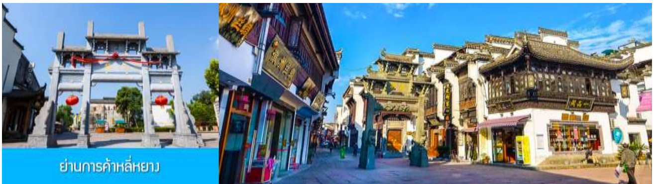
ย่านการค้าหลี่หยาง

อิสระอาหารมื้อกลางวัน ( ท่านสามารถเลือกชิมอาหารพื้นเมืองในระแวกโรงแรมได้ตามอัธยาศัย )