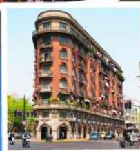
ถนนอุคิง