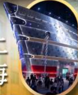
เรือเดอะหลุยส์