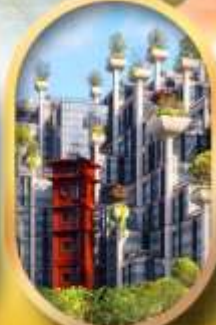
อาคารพินตันไม้