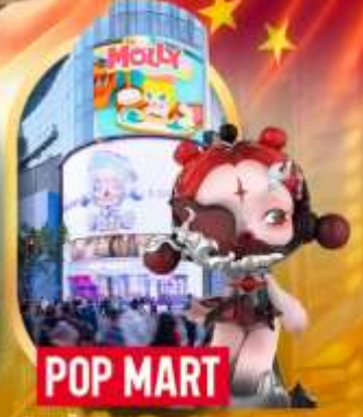
ช้อปปิ้งร้าน Pop Mart