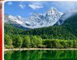
อูทยานปี้ฝิงโถว