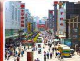
ช้อปปิงถนนคนเดินชุนซีลู่