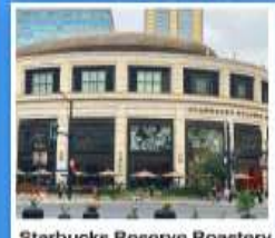
Starbucks Reserve Roastery