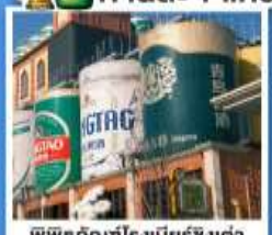
พิพิธภัณฑ์เบียร์ชิงเต่า