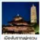
หมู่บ้านเหมียนฮวาหวาน