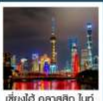
เชียงใหม่ ทัศนิก ไนท์