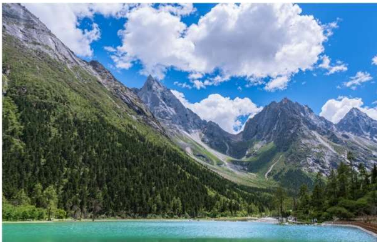
BIPENGGOU NATIONAL PARK 毕棚沟