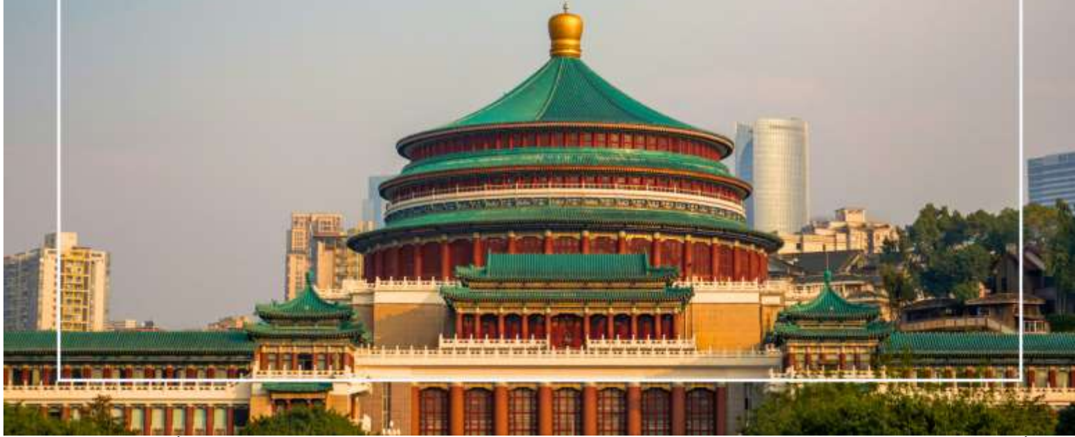
มหาศาลาประชาชนแห่งเมืองฉงชิ่ง (Chongqing People's Grand Hall)

จากนั้นนำท่าน นั่งรถไฟทะเลลู่ตีก เป็นหนึ่งในประสบการณ์ที่น่าสนใจและเป็นเอกลักษณ์ในเมืองฉงชิ่ง รถไฟเส้นนี้มีเส้นทางที่ผ่านอาคารและที่อยู่อาศัย ทำให้ผู้โดยสารรู้สึกเหมือนกำลังนั่งรถไฟที่ทะลุผ่านตึกสูง เส้นทางที่น่าสนใจในรถไฟนี้รวมถึงสถานีที่มีชื่อเสียง เช่น สถานีหลี่จื่อป่า (Liziba Station) ซึ่งตั้งอยู่ในพื้นที่ที่มีความหนาแน่นของประชากร การนั่งรถไฟทะเลลู่ตีกนี้เป็นวิธีที่ยอดเยี่ยมในการสัมผัสกับวัฒนธรรมเมืองฉงชิ่งและชื่นชมกับการพัฒนาเมืองที่น่าทึ่ง