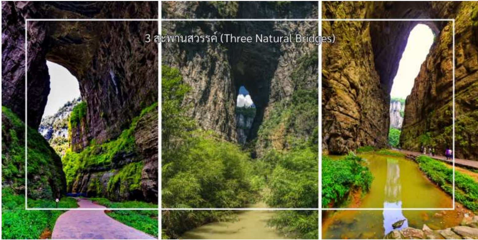
3 สะพานสวรรค์ (Three Natural Bridges)

เย็น บริการอาหารเย็น ณ ภัตตาคาร (มื้อที่3) เมนูพิเศษ : อาหารเสฉวน จากนั้นเดินทางเข้าสู่โรงแรมที่พัก Wulong yiyun Hotel ระดับ 4 ดาว หรือเทียบเท่า