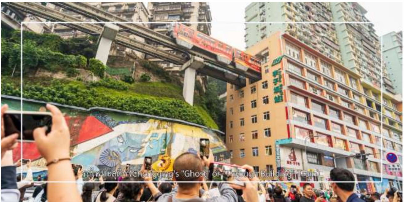
รถไฟทะเลลู่ตีก (Chongqing's "Ghost" or "Through" Building)

จากนั้นนำท่าน นั่งรถไฟทะเลลู่ตีก เป็นหนึ่งในประสบการณ์ที่น่าสนใจและเป็นเอกลักษณ์ในเมืองฉงชิ่ง รถไฟเส้นนี้มีเส้นทางที่ผ่านอาคารและที่อยู่อาศัย ทำให้ผู้โดยสารรู้สึกเหมือนกำลังนั่งรถไฟที่ทะลุผ่านตึกสูง เส้นทางที่น่าสนใจในรถไฟนี้รวมถึงสถานีที่มีชื่อเสียง เช่น สถานีหลี่จื่อป่า (Liziba Station) ซึ่งตั้งอยู่ในพื้นที่ที่มีความหนาแน่นของประชากร การนั่งรถไฟทะเลลู่ตีกนี้เป็นวิธีที่ยอดเยี่ยมในการสัมผัสกับวัฒนธรรมเมืองฉงชิ่งและชื่นชมกับการพัฒนาเมืองที่น่าทึ่ง