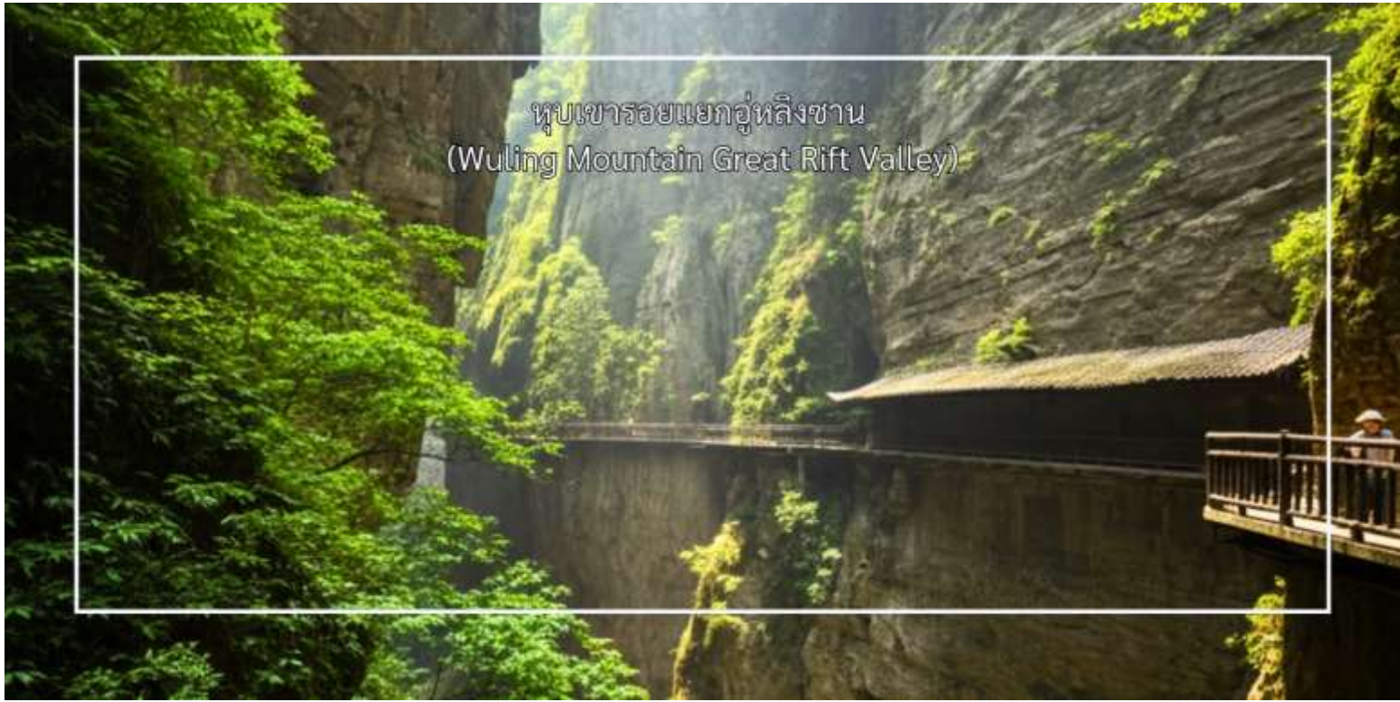
หุบเขารอยแยกอู่หลิงซาน (Wuling Mountain Great Rift Valley)

แนวถ่ายภาพ ฐานวิศวกรรมนิวเคลียร์ 816 (816 Nuclear Engineering Base) โครงการลับสุดยอดของจีนในยุคสงครามเย็น เป็นฐานใต้ดินขนาดมหึมาที่เจาะลึกเข้าไปในภูเขาใช้เวลาสร้าง 17 ปี แรงงานทหารกว่า 60,000 นาย มีอุโมงค์ยาวกว่า 20 กิโลเมตร ภายในมีห้องโถงที่ใหญ่ที่สุดสูงเท่าตึก 20 ชั้น หลังจากการยกเลิกโครงการ ฐานแห่งนี้ก็ถูกปิดเป็นความลับนานหลายปี ก่อนที่จะได้รับการปลดความลับในปี 2002 และเปิดให้เป็นแหล่งท่องเที่ยวในปี 2010 ซึ่งไม่มีสารกัมมันตรังสี และเปิดให้เข้าชมความอลังการของวิศวกรรมการก่อสร้างใต้ดิน ที่ไม่เคยถูกใช้งานจริง สมควรแก่เวลานำท่านเดินทางกลับ ฉงชิ่ง (ใช้เวลาประมาณ 2.30 ชั่วโมง)