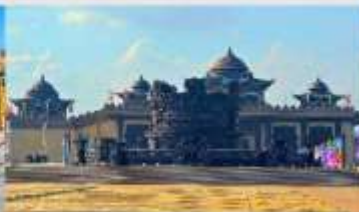
ศูนย์วัฒนธรรมหยวนหยิว