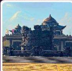
ศูนย์วัฒนธรรมหยวนหยิว