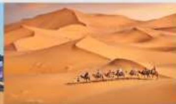
ทะเลทรายเสี่ยงชวาน