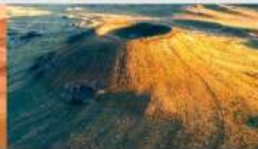
ภูเขาไฟอูลันฮาตา

*ทางบริษัทฯ ขอสงวนสิทธิ์ในการสลับโปรแกรมทัวร์ตามความเหมาะสมขึ้นอยู่กับสถานการณ์ทำงาน โดยคำนึงถึงผลประโยชน์ของลูกค้าเป็นสำคัญ