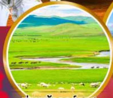
ทุ่งหญ้าออร์โดส