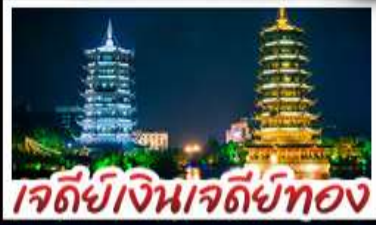
เจดีย์เงินเจดีย์ทอง

หมู่บ้านแม้วซีเจียง - จั๋งจายโกวน้อย - เสียวชีโซว เมืองโบราณเซยสี่อ+ล่องเรือ - เจดีย์เงินเจดีย์ทองวิวก้า เขางวงช้าง - สะพานแดงหรูอี้ - รถไฟความเร็วสูง ไม่ลงร้านช้อปปิ้ง - เมบูพิศษ บูฟเฟต์ชาบูซีฟู้ด ปลาอบเนียร์ เผือกคริสตัล สุกี้หัด