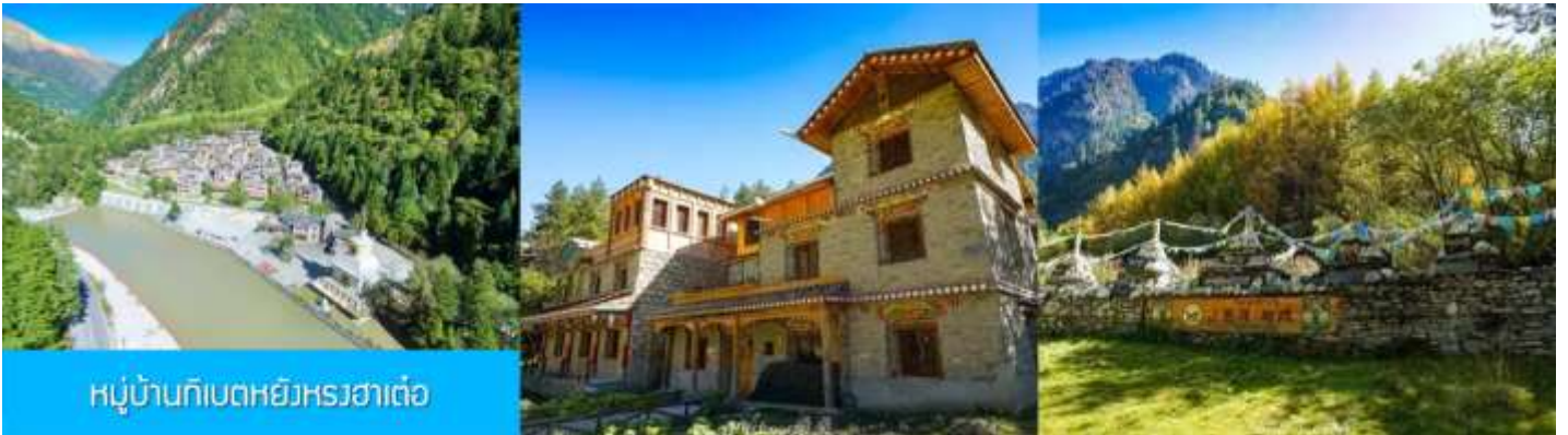
หมู่บ้านทิเบตหยั่งหรงฮาเต๋อ

เที่ยง รับประทานอาหารกลางวัน ณ ร้านอาหารพื้นเมือง (8)