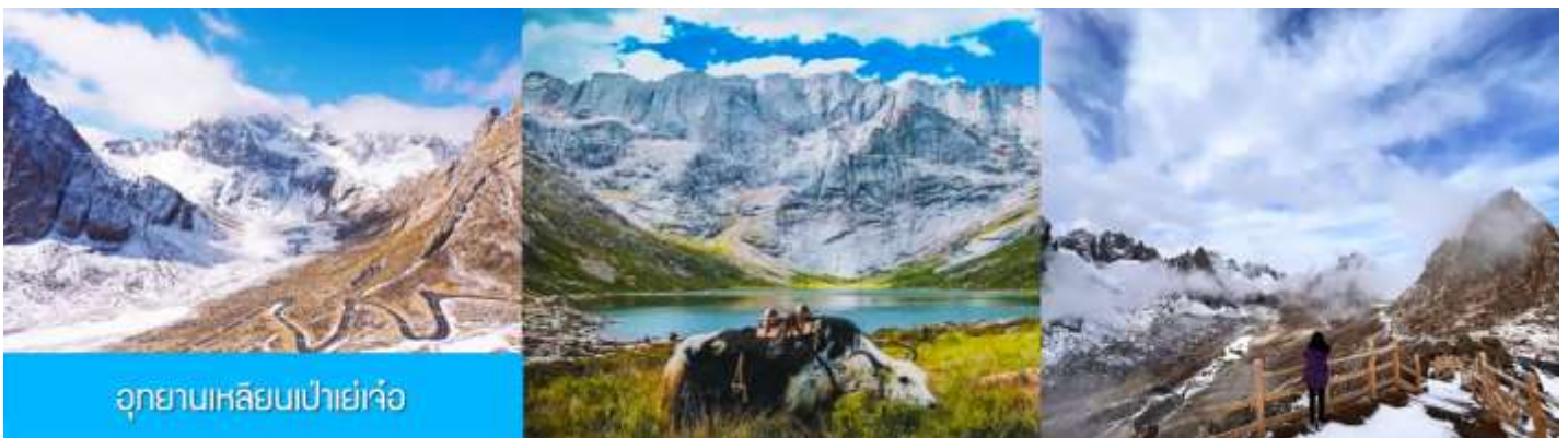
อุทยานเหลียนเป่าเย่าจ้าว

พักที่ โรงแรม ZUNGE ZHUOYUE HOTEL ระดับ 4 ดาวท้องถิ่นหรือเทียบเท่าในอำเภออาป้า