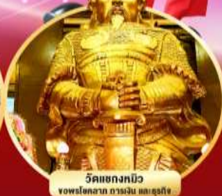
วัดเขกทงมือ ขอพรโชคลาภ การเงิน และธุรกิจ