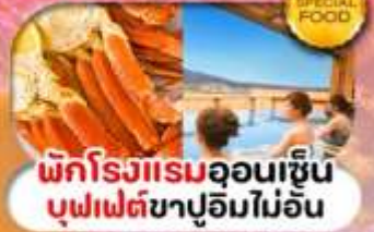
ที่พักโรงแรมออนเซ็น บุฟเฟต์ชาปูอิมโมอัน