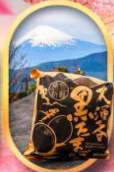
หุบเขาโอวาคุดานิ