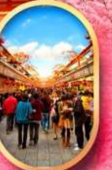
ถนน นากาบิเสะ