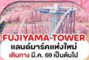
FUJIYAMA-TOWER แลนด์มาร์คแห่งใหม่ เดินทาง น.ค. 69 เป็นต้นไป