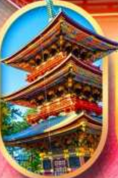
วัดนาริตะ