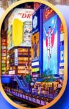
ย่านชิบะฮาชิจิ