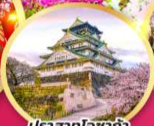
ปราสาทโซาก้า