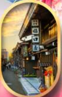
เมืองเก่าทาคายามา