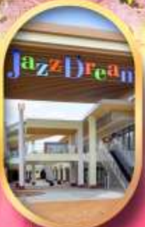
มิทซึยูอิฮาร์เก็ต