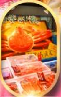
ตลาดปลาฮิองโก