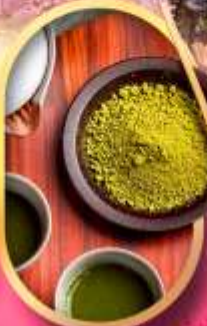
ชงชาแบบญี่ปุ่น