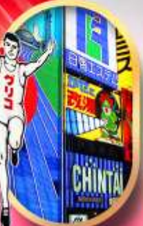
ช้อปปิ้งชินโซนาชิ