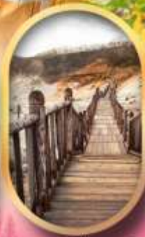
หุบเขาจิทอกุคาบิ