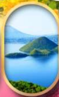
อ่าวทะเลสาบโทโยะ