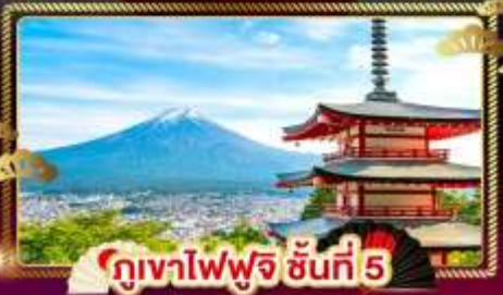
ภูเขาไฟฟูจิ ชั้นที่ 5

ชมลาวเนเดอร์ ที่ สอนโออิชิปาร์ค อิสระ 1 DAY TRIP