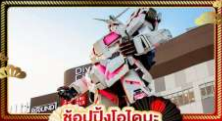
ช้อปปิ้งโอไดบะ