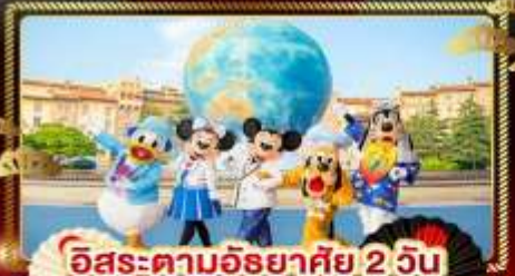
อิสระตามอริยาศย 2 วัน