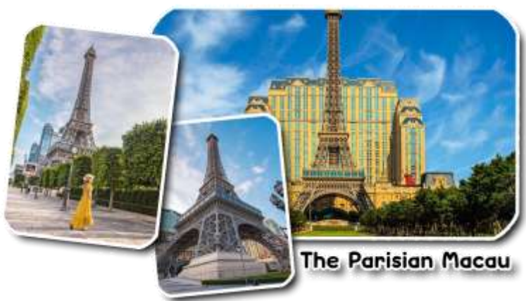
The Parisian Macau

และนำท่านชม The Parisian Macao (เดอะปารีสเซียน มาเก๊า) เป็นอีกหนึ่งแลนด์มาร์คของมาเก๊าที่ได้ยกหอไอเฟลมาจำลองใจกลางเมือง Cotai Strip โรงแรมแห่งนี้ได้รับแรงบันดาลใจมาจากเมืองปารีส ประเทศฝรั่งเศส นครแห่งศิลปะที่มีความงดงามทางด้านสถาปัตยกรรม ความโดดเด่นของหอไอเฟลกลิ่นอายของความคลาสสิกและความโรแมนติกมาไว้ที่โรงแรมแห่งนี้