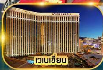
เวเนเซียน