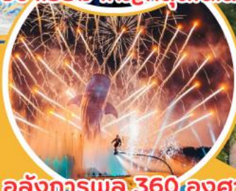
อลังการพลุ 360 องศา