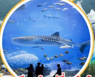
อควาเรียมใหญ่ที่สุดในโลก