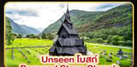
Unseen ไม้สัก Borgund Stave Church