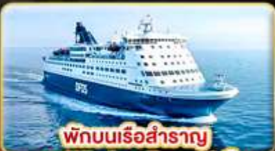
พักผ่อนเรือสำราญ แบบ Window Room 1 คืน

สัมผัสความเป็นที่สดุของ สแกนดิเนเวีย ให้ท่านได้พักผ่อนแบบ SLOW LIFE