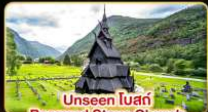
Unseen โบสถ์ Borgund Stave Church