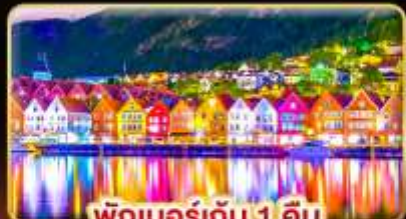
พักเบอร์เกน 1 คืน