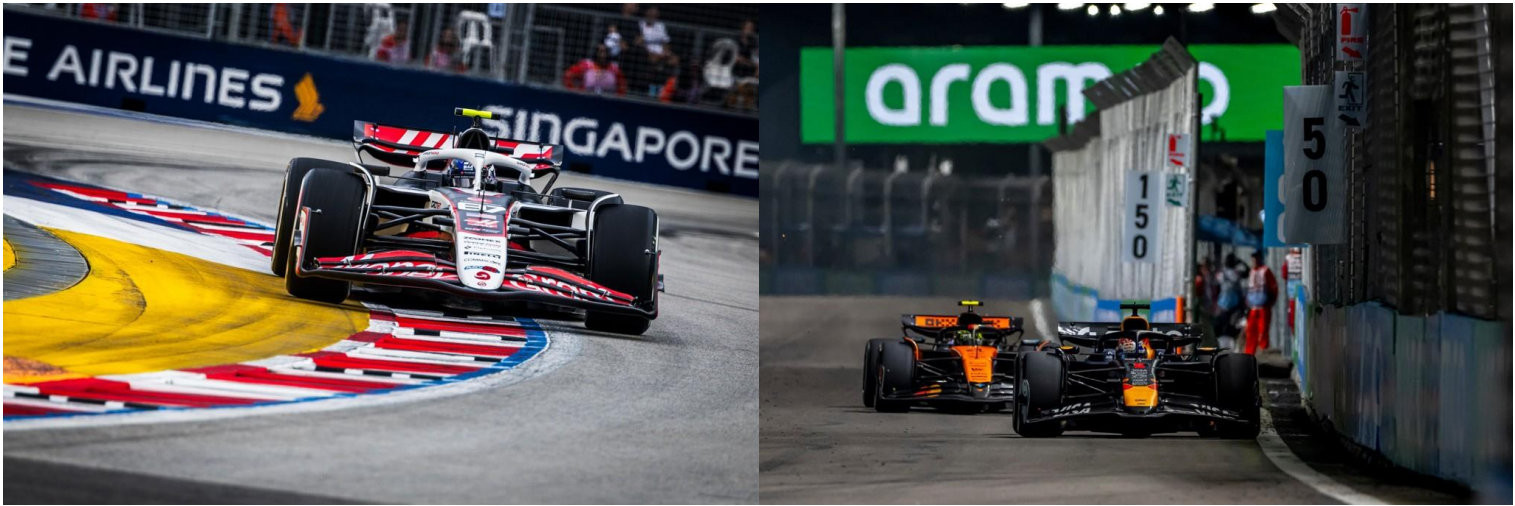
ชม รอบ SPRINT RACE + QUALIFYING

**เดินทางด้วยตนเอง เข้าร่วมงาน FORMULA 1 SINGAPORE GRAND PRIX 2026**