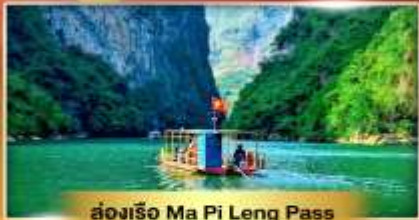
ส่องเรือ Ma Pi Leng Pass

เส้นทางเปิดใหม่ ซาฮายาง เช็คอินเมืองตามด้าว "เวียดนามฟีลยูโรป"