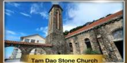
Tam Dao Stone Church